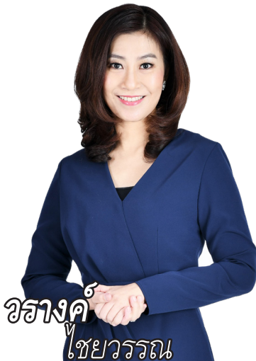
วรงค์ไชยวรรณ

พิทช์เรตติ้งส์ ประเมินว่า ไทยประกันชีวิตมีโครงสร้างเงินกองทุนที่แข็งแกร่ง สะท้อนจาก